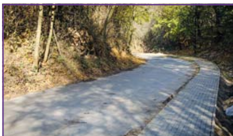
Dys – chodnik przy drodze nr 106055L