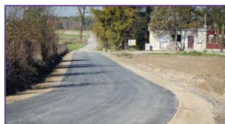
Stoczek - wyremontowana droga nr 106032L