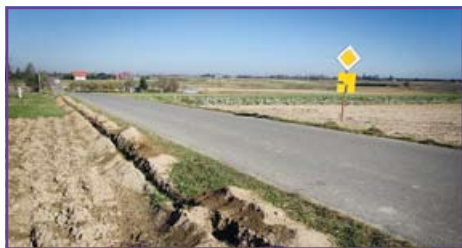
Ciecierzyn - ruszyła budowa oświetlenia przy drodze nr 106053L