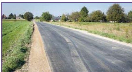
Nowa nawierzchnia ul. Świerkowej w Jakubowicach