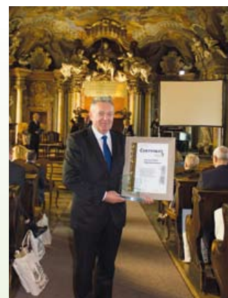
W Auli Leopoldyńskiej Uniwersytetu Wrocławskiego