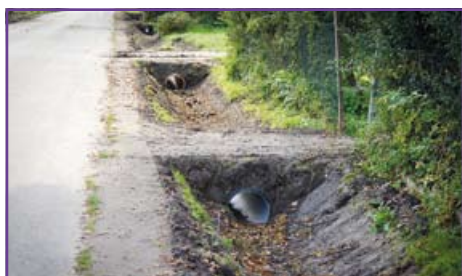
Odwodnienie drogi w Nowym Stawie