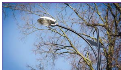
Nowe oświetlenie zapewni bezpieczeństwo mieszkańcom Pólka