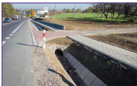
Ciecierzyn chodnik przy Drodze Krajowej nr 19