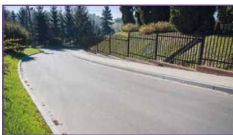
Dys – podjazd do szkoły