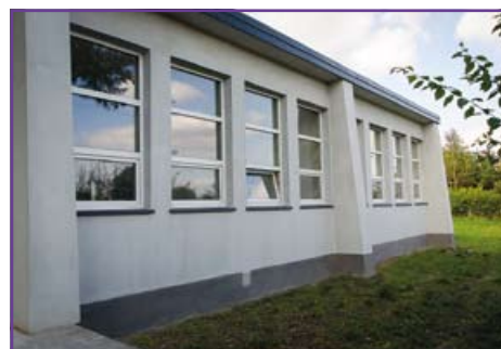
Świetlica w Nowym Stawie

konanie odwodnienia drogi w Nowym Stawie. Koszt wyżej wymienionych zadań to ponad 1 milion złotych. Gotowy jest również chodnik w Ciecierzynie wzdłuż drogi krajowej nr 19 (na wniosek wójta gminy Niemce Krzysztofa Urbasia, GDDKiA wykonała chodnik z własnego budżetu).