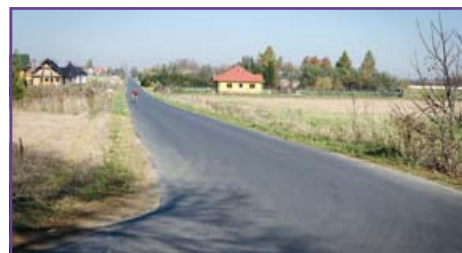
Rudka Kozłowiecka – zmodernizowana droga nr 106048L

Nie ustają prace przy gminnych inwestycjach. W Jakubowicach Konińskich pojawiły się dwa odcinki dróg asfaltowych. Ul. Brzozowa i ul. Świerkowa mają już nowe nawierzchnie. 100 metrowy odcinek w miejscowości Stoczek również jest ukończony. Poszerzony został podjazd do Szkoły Podstawowej w Dysie. Przed przebudową rodzice dowożący dzieci na zajęcia musieli podjeżdżać do szkoły w ruchu wahadłowym.