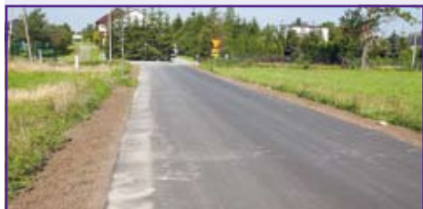
nowy 400 metrowy fragment drogi powiatowej 1550L łączącej Rudkę Kozłowiecką z Wołą Niemiecką