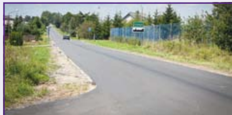
odbudowana droga w Leonowie

Na terenie gminy rozpoczęto także nowe zadanie. W miejscowości Stoczek przebudowywana jest droga gminna nr 106030L o długości 688 m. Przewidywany koszt inwestycji to blisko 374 000 zł.