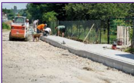
budowa chodnika w Niemcach