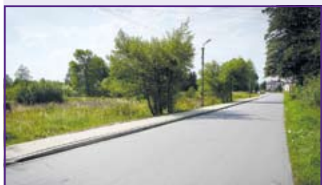
chodnik w Woli Niemieckiej, przedłużający o 300 metrów już istniejący na ul. Różanej w Niemcach

Na przełomie czerwca i lipca w naszej gminie pojawiły się dwie nowe drogi o nawierzchni bitumicznej, kolejne dwie zostały gruntownie wyremontowane oraz powstały trzy nowe odcinki chodników.