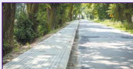
ostatni 355 metrowy odcinek chodnika połączył Dys i Półko