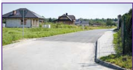
nowy fragment ulicy o nawierzchni bitumicznej w Niemcach