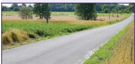
750 metrowy odcinek nowej drogi asfaltowej w Krasieninie