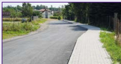
Niemce – przy nowej ulicy powstał chodnik