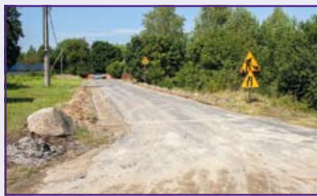
W Stoczku przebudowywana jest droga gminna o długości 688 m