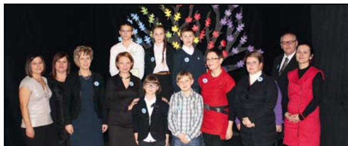
Zwycięzcy w kategorii klas V-VI