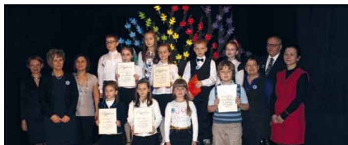
Zwycięzcy w kategorii klas III-IV