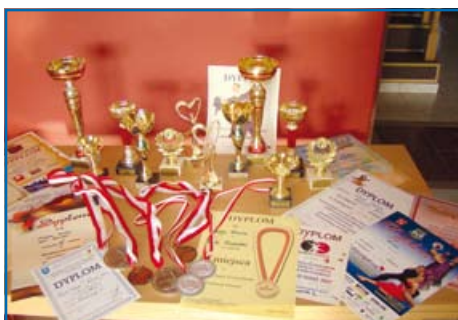
medale, dyplomy i puchary z trudem mieszczą się na stole