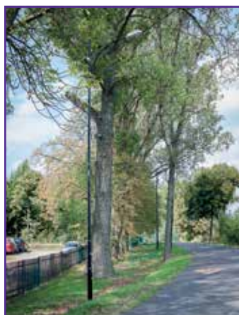
Oświetlenie w Nasutowie

Pierwsze półrocze b.r. w naszej gminie to były głównie inwestycje drogowe, natomiast drugie wypełniają prace przy rozbudowie sieci oświetleniowej oraz przy budowie SKATEPARKU w Niemcach.