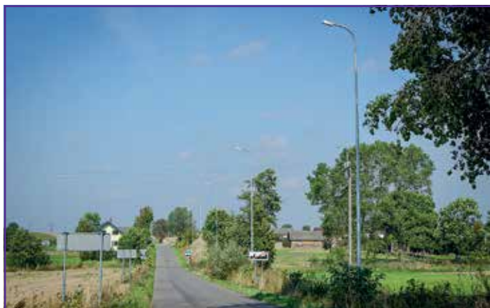
Oświetlenie w Osówce