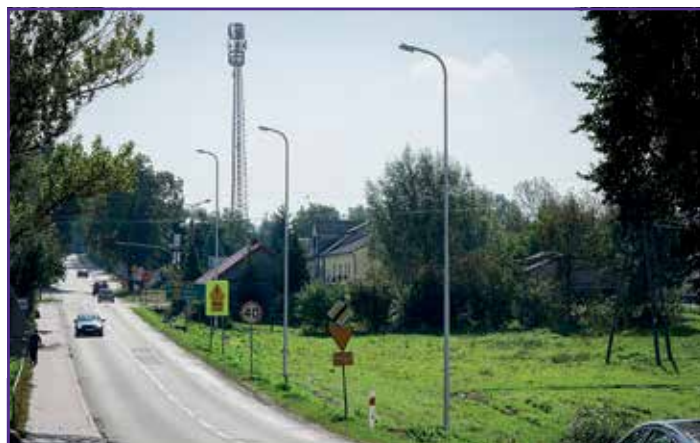
Oświetlenie w Krasieninie przy pałacu