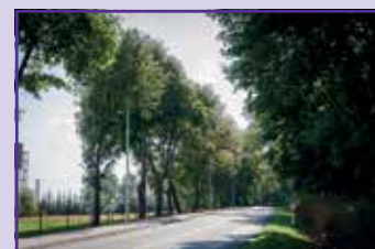
Oświetlenie w Majdanie Krasienińskim

instalowane cztery lampy, na ukończeniu są trzy odcinki oświetlenia drogowego w miejscowościach: Swoboda – 200 m przy drodze powiatowej nr 2222L, Osówka – 400 m przy drodze powiatowej 2201L i Krasienin Kolonia 800 m przy drodze wojewódzkiej nr 809 (przy pałacu). W wymienionych lokalizacjach lampy już stoją, czekamy tylko na podłączenie ich do sieci energetycznej. Kolejne trzy odcinki oświetlenia są w trakcie budowy. W Krasieninie przy drodze wojewódzkiej nr 809 w kierunku Majdanu Krasienińskiego realizuje się kolejne 700 m, a w Elizówce przy dwóch ok. 500 m odcinkach rozpoczęły się prace ziemne. Przybliżony koszt realizacji tych inwestycji to 692 tys. zł.