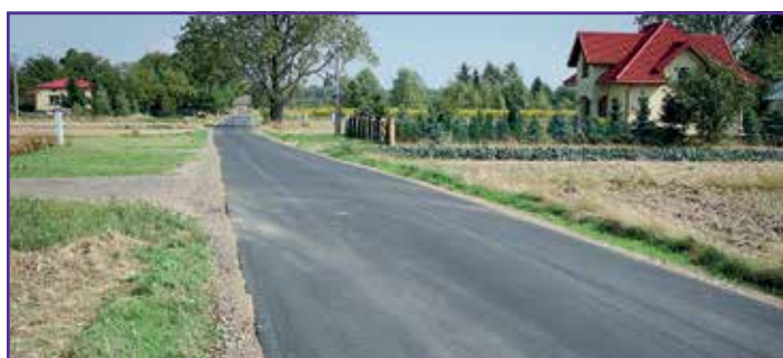
Droga na ul. Klonowej w Jakubowicach Konińskich