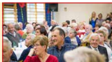
Szkoła podstawowa w Krasieninie