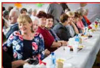
Szkoła Podstawowa w Niemcach

Kierownik Ośrodka Pomocy Społecznej w Niemcach