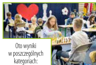
Oto wyniki w poszczególnych kategoriach:

Zawody objęte zostały honorowym patronatem: Konsula Ukrainy, Marszałka Województwa Lubelskiego, Wojewody Lubelskiego, Starosty Powiatu Lubelskiego, Wójta Gminy Niemce oraz Lubelskiego Kuratora Oświaty.