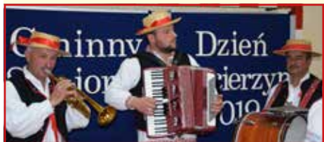
Zespół Placówek Oświatowych w Ciecierzynie