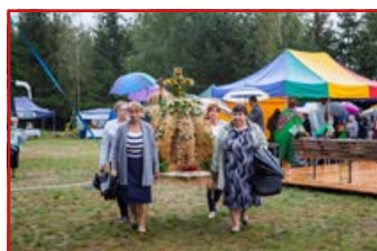
KGW w Baszkach