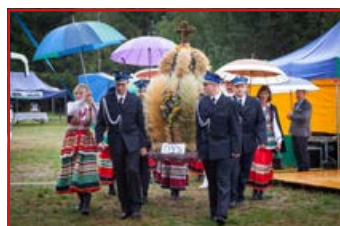
KGW i Zespół Ludowy „Dysowiacy”