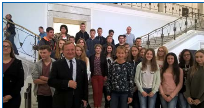
Wizyta w Sejmie na Wiejskiej. EDD 2017.