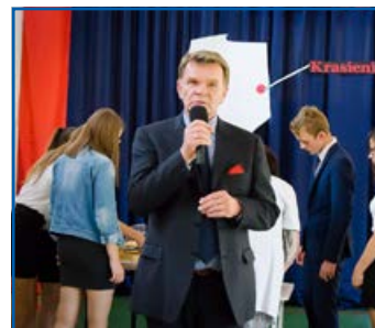
Podsumowania 10 edycji EDD 2017.