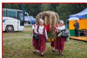
KGW w Niemcach