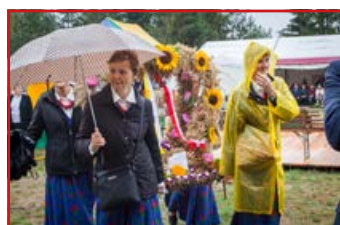
Wieniec Sołectwa Kawka