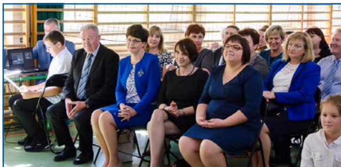
Honorowi goście EDD Krasienin 2017.