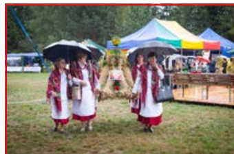
KGW w Półku