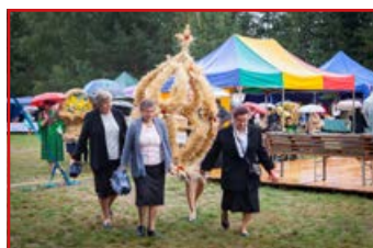
KGW w Łagiewnikach