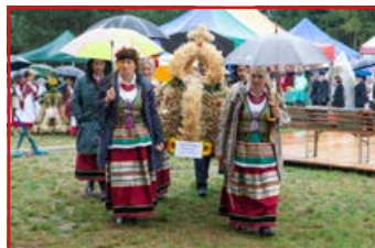
KGW i Zespół Ludowy „Ciecierzyn”