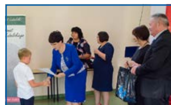
Wręczenie dyplomów i nagród. EDD Krasienin 2017.