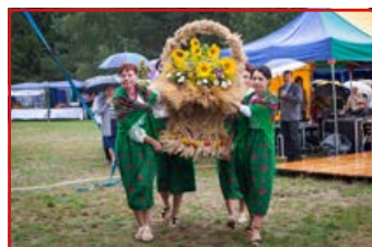
KGW w Woli Niemieckiej