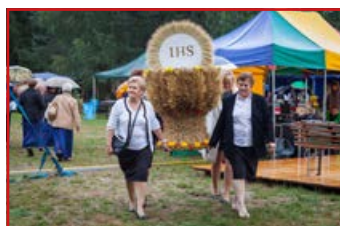
KGW w Rudce Kozłowieckiej