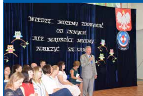
Szkoła w Dysie