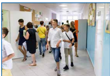
Szkoła w Rudce Kozłowieckiej