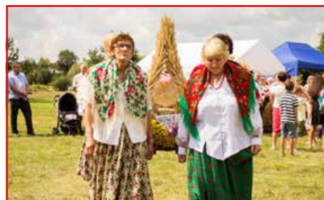
Sołectwo Nowy Staw