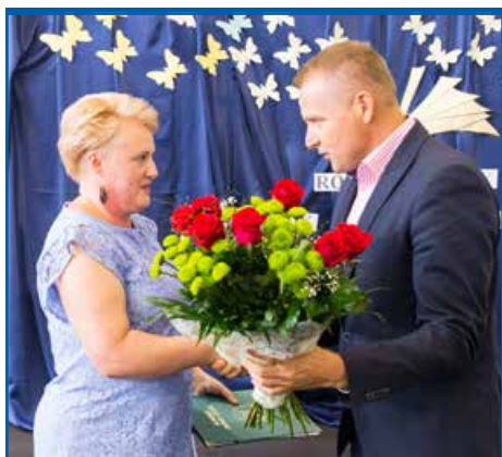
Szkoła w Jakubowicach Konińskich

Wszystkim nauczycielom życzymy wiele sił i energii potrzebnych dla kształcenia nowych pokoleń, a uczniom wytrwałości i zapału w zdobywaniu wiedzy.