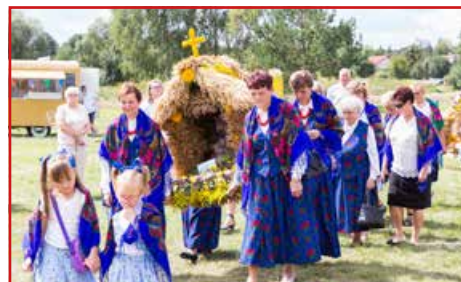
KGW w Kawce

zana specjalnie na tę okazję grupa artystyczna z Nowego Stawu.