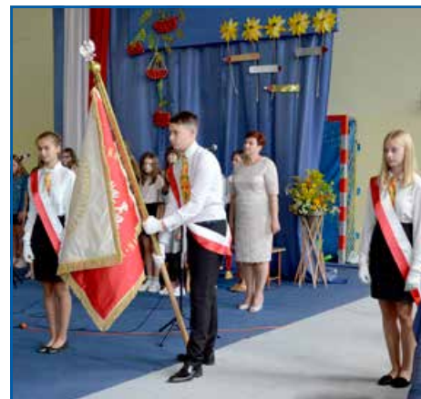
Szkoła w Niemcach

W tym miejscu należy zaznaczyć, że inauguracja roku szkolnego w Krasieninie miała szczególny charakter. Ostatnie prace budowlane w sali gimnastycznej, kończące gruntowny remont szkoły, wymusiły organizację uroczystości na korytarzu. Już od połowy czerwca rozpoczęły się prace w zakresie modernizacji budynku ze środków unijnych pozyskanych przez Gminę Niemce. Wartość remontu to 1,2 mln zł. Jego efekt widać już na pierwszy rzut oka, gdyż budynek został odnowiony, docieplony i odmalowany. Wymieniono pokrycie dachowe oraz okna na nowej części budynku, a na połaciach dachowych pojawiły się ogniwa fotowoltaiczne. Równie wiele, a może nawet więcej działa się wewnątrz budynku: wymieniono przyłącze elektryczne na ziemne, instalację elektryczną oraz oświetlenie, wewnętrzną sieć LAN – która dostosowana jest do przyłączenia