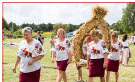
KGW Rudka Kozłowiecka