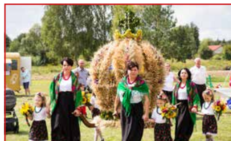
KGW Wola Niemiecka