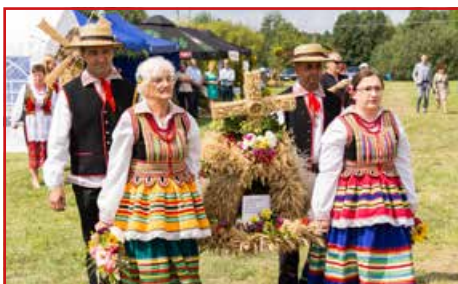
Stowarzyszenie im. I. Kosmowskiej