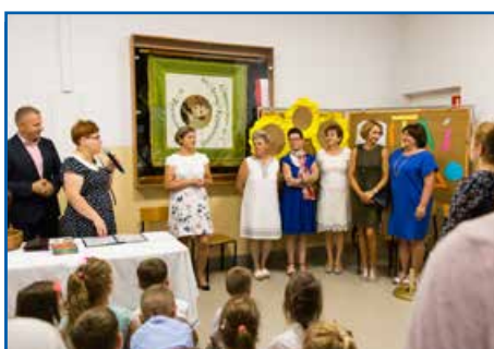
Szkoła w Krasieninie