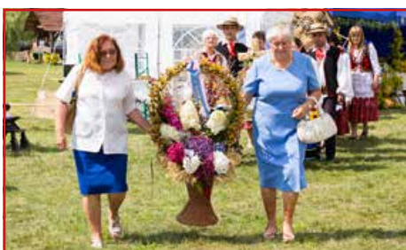
KGW Majdan Krasieniński

Spółdzielnia Usług Rolniczych w Elizówce