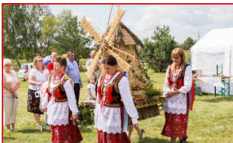
KGW w Krasieninie