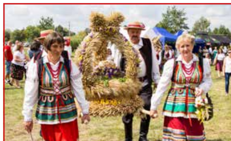
Zespół Ludowy Dysowiacy