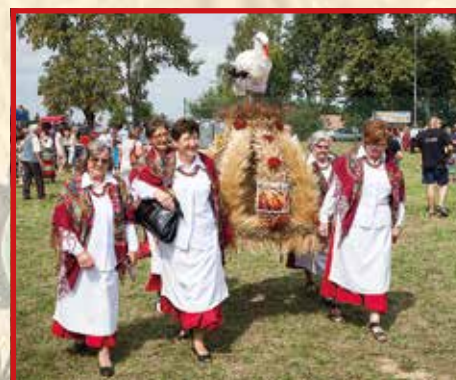
KGW w Półku