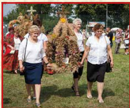
KGW w Rudce Kozłowieckiej