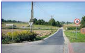
Łącznik na ul. Brzozowej