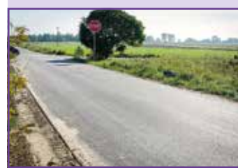
Nasutów dr 106082L