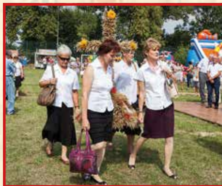
KGW w Kawce