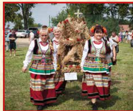
KGW w Ciecierzynie i Zespół Ludowy „Ciecierzyn”