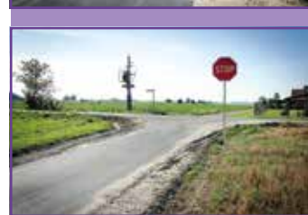
Nasutów dr 106043L

600 metrów drogi gminnej nr 106067L w Ciecierzynie oraz prace przy budowie sali sportowej przy Szkole Podstawowej im. Joachima Lelewela w Jakubowicach Konińskich.