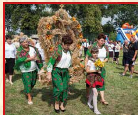
KGW w Woli Niemieckiej