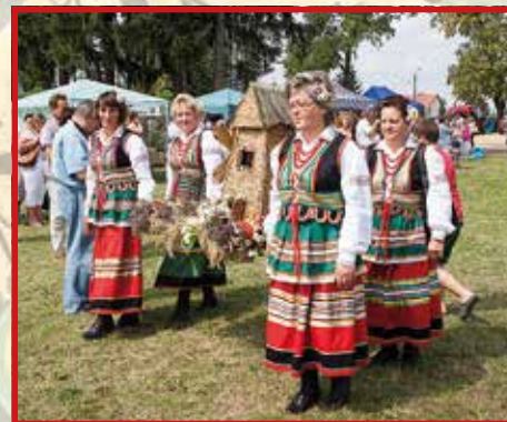
KGW w Dysie i Zespół Ludowy „Dysowiaci”