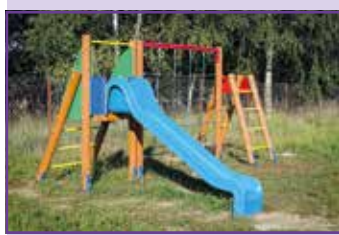
Plac zabaw - Pryszczowa Góra

W numerze 02/120/2016 „Takiej Gminy” pisaliśmy o wielu rozpoczętych pracach remontowo – budowlanych na terenie naszej gminy, a dziś możemy już poinformować, że większość tych inwestycji została ukończona. Przez ten czas w Gminie Niemce między innymi przybyło ponad 5 kilometrów dróg asfaltowych.