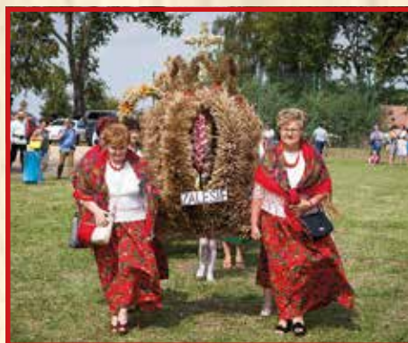
KGW w Zalesiu