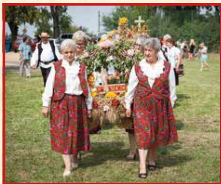
KGW w Niemcach