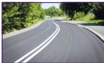
Jakubowice Konińskie droga powiatowa