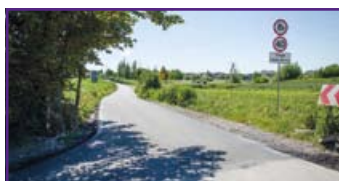
ul. Cedrowa w Jakubowicach Konińskich