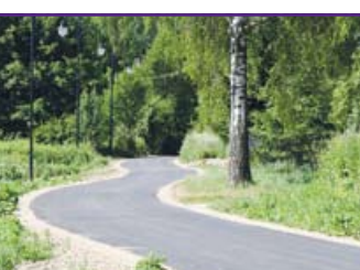
ul. Ogrodowa w Dysie