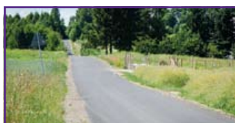
ul. Zemborska w Jakubowicach Konińskich