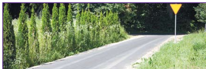
droga na Półku