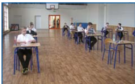
egzamin 6 klas Dys