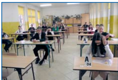
egzamin 6 klas Niemce