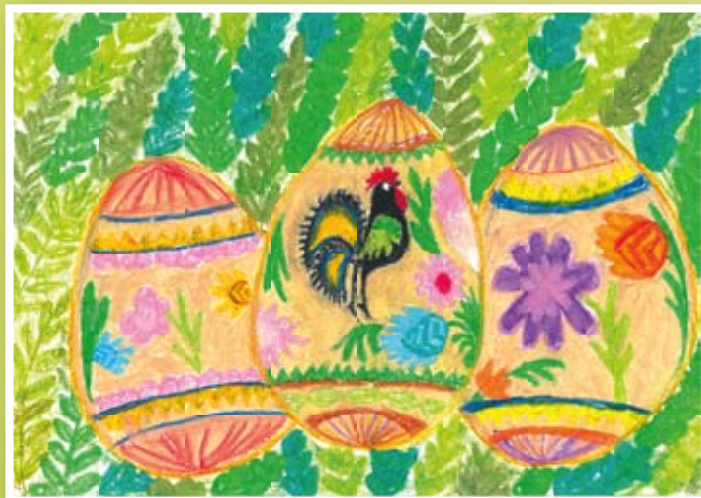
I miejsce – Weronika Ćwikła – kl. VI Szkoła Podstawowa w Nasutowie