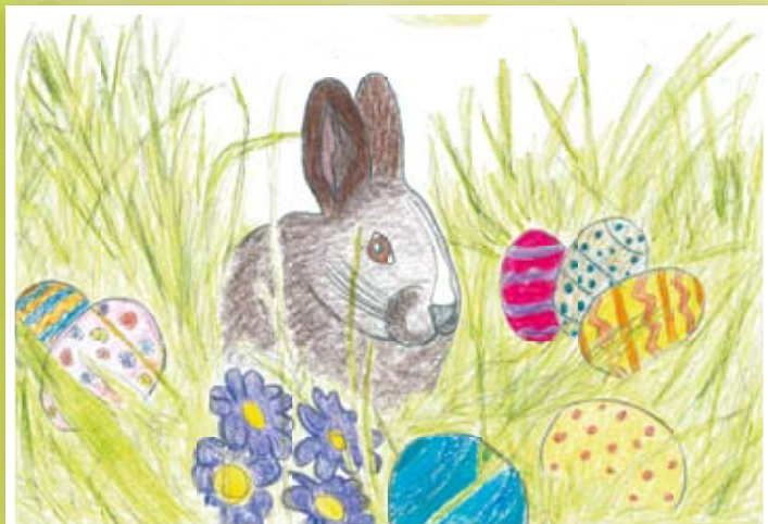
nagroda główna - praca Klaudii Raboszuk - uczennicy kl. III A Gimnazjum w Ciecierzynie