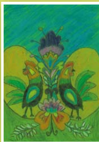
III miejsce – Kinga Guz – kl. VI Szkoła Podstawowa w Krasieninie